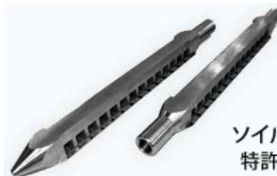
ソイルキャッチャー 特許第5071875号